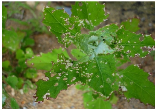
Perforations sur chénopode