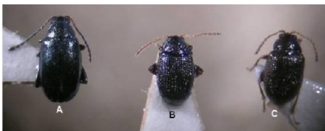
Phyllotreta atra (A), Epitrix similis (B) e Epitrix cucumeris (C)