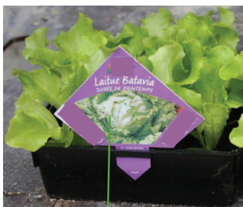
PP imprimé au dos

Exemples non exhaustifs d'apposition de Passeport Phytosanitaire :