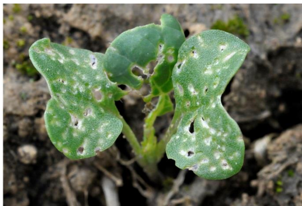
Plus de 25 % de la surface touchée