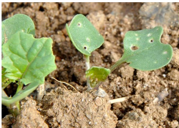
Moins de 25 % de la surface touchée

→ 8 pieds sur 10 portants des morsures. Il ne faut pas dépasser plus \frac{1}{4} de la surface végétative détruite. Au-delà du nombre de plantes avec dégâts, il est important de déterminer la surface végétative endommagée. En cas de levée tardive (après le 1er octobre), la vitesse de développement des colzas est ralentie et le seuil peut être abaissé à 3 plantes avec morsures sur 10.