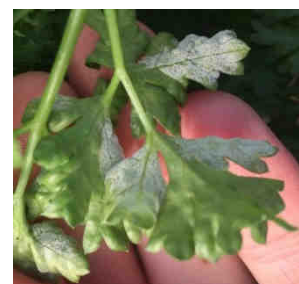
Mildiou sur persil

Nous recherchons des entreprises observatrices pour alimenter le BSV. Les cultures observées cette année sont :