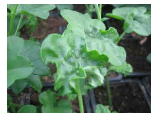
Dégâts d' Aulacorthum solani sur pélargonium

Thrips ( Frankliniella occidentalis ) : deux individus adultes sont signalés sur culture. La population sur panneaux chromatiques est plus élevée : 19 individus. Le suivi avec les Outils d'Aide à la Décision (piégeage et comptage) est important .