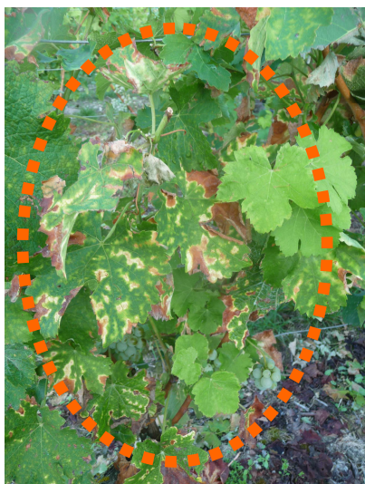
Forme lente (MB - 07/09/15)

Par contre, nous avons observé dans un certain nombre de parcelles, des symptômes sous forme de ponctuations - voir photo droite