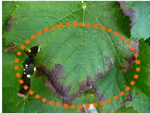
MB – 01/09/15 - Grillures / Cicadelles vertes sur Cot

Peu de symptômes globalement observés (décolorations et marbrures) en fin de saison sauf sur cépages sensibles notamment de Cot ou des parcelles conduites en cultures biologiques ou des parcelles en confusion sexuelle.