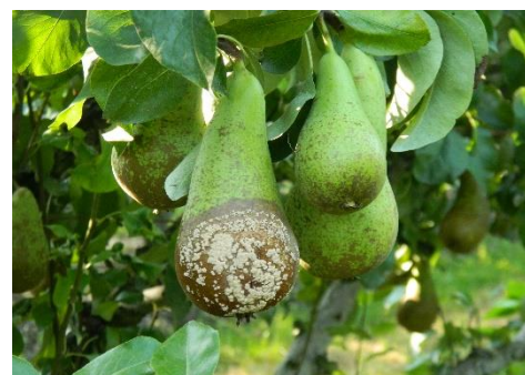
Moniliose sur Conférence

Les symptômes apparaissent par la suite durant la conservation après une période plus ou moins longue de stockage. En général, la contamination a lieu au verger pendant la période de croissance des fruits et/ou lors de la récolte.