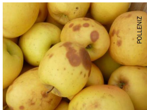
Gloeosporium sp. sur Tentation

Les parasites de blessures : Ces parasites pénètrent dans les fruits par des portes d'entrées accidentelles et ont un développement rapide. La contamination peut se faire en vergers mais aussi dans les locaux de conservation.