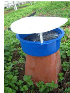
Piégeage de Duponchelia fovealis

Duponchelia fovealis s'attaque aux collets et racines des plantes. Il est préjudiciable pour les cultures de cyclamen, de Bégonia et de Kalanchoë. En trop grande proportion, il élargit sa gamme de plantes-hôtes. Il se conserve à l'extérieur des serres en période de faible production.