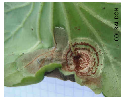
Rouille du Pélargonium

Lutte génétique : sélection de cultivars moins sensibles.