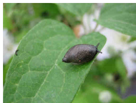
Escargots sur cultures horticoles