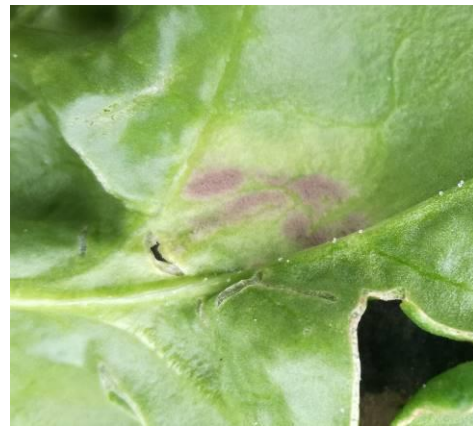
A gauche, symptôme de jaunissement face supérieure. A droite, on observe un duvet violacé sous la feuille.