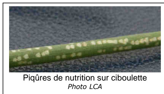
Piqûres de nutrition sur ciboulette

En plein-air, les premières piqûres sur les ciboulettes du réseau de piégeage ont été observées à Tour-en-Sologne.