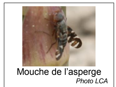
Mouche de l'asperge

Le seuil est atteint dès la constatation de sa présence. Sa présence est à surveiller sur les premières et deuxièmes pousses. La période sensible pour la plante se situe entre le stade pointe et le stade début de ramification.