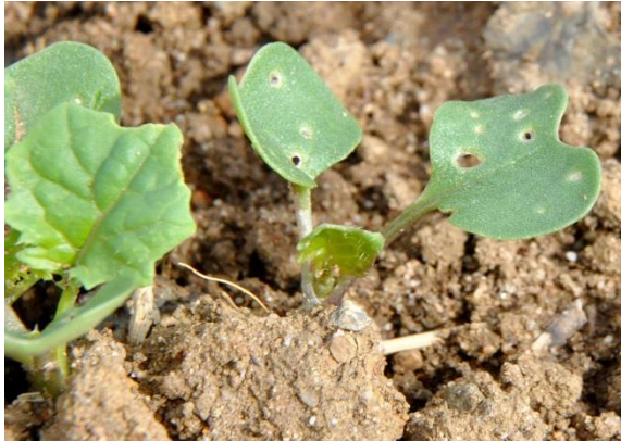
Moins de 25 % de la surface touchée

→ 8 pieds sur 10 portant des morsures. Il ne faut pas dépasser plus ¼ de la surface végétative détruite. Au-delà du nombre de plantes avec dégâts, il est important de déterminer la surface végétative endommagée. En cas de levée tardive (après le 1 er octobre), la vitesse de développement des colzas est ralentie et le seuil peut être abaissé à 3 plantes avec morsures sur 10.