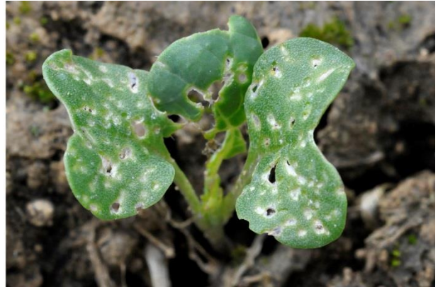
Plus de 25 % de la surface touchée