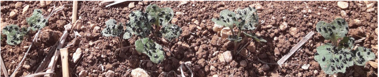
Photo du lundi 4 septembre 2017, Saint Valentin, Indre, Terres Inovia

Attention, les dégâts de petites altises qui se concentrent surtout dans un premier temps en bordure de parcelles peuvent conduire à une destruction totale des plantes et conduire à un resemis.