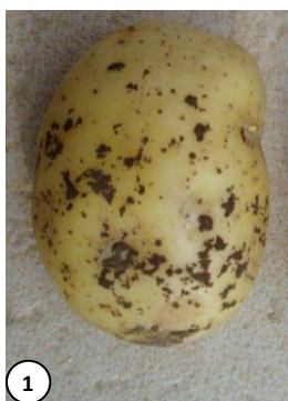
Photo 1 : Sclérotose de rhizoctone brun

Ce champignon altère la présentation des pommes de terre en formant des sclérotose noirs sur l'épiderme. En cas de forte contamination des plants, des problèmes de levée peuvent être observés surtout quand les conditions climatiques sont froides et humides et le plant mal préparé. En attaque plus tardive, un manchon de mycélium blanchâtre peut apparaître à la base des tiges et des tubercules aériens peuvent se développer à l'aisselle des feuilles.