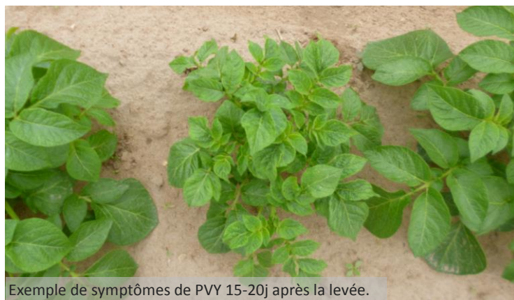
Exemple de symptômes de PVY 15-20j après la levée.

Le groupe pucerons/pomme de terre/pyréthrinoides et carbamate est exposé à un risque de résistance.