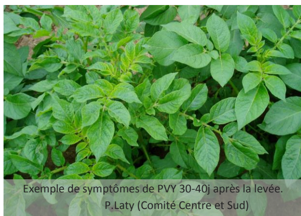
Exemple de symptômes de PVY 30-40j après la levée. P.Laty (Comité Centre et Sud)