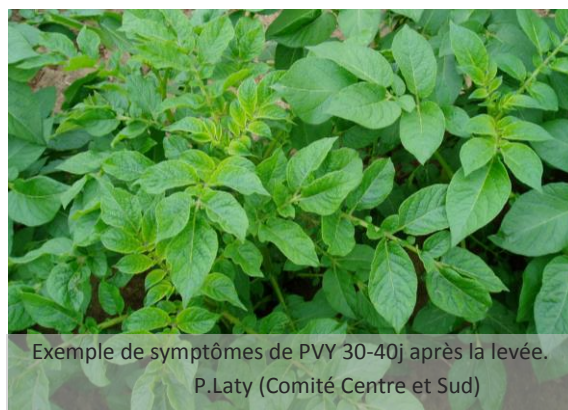
Exemple de symptômes de PVY 30-40j après la levée. P.Laty (Comité Centre et Sud)