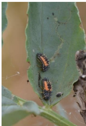
Larves de coccinelle

Suivre régulièrement l'évolution des manchons sur tiges et d'intervenir dès que 10% des tiges portent un manchon d'au moins 1 cm.