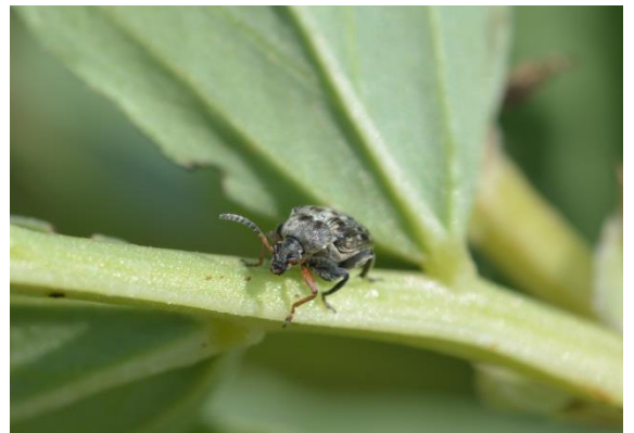
L. JUNG - CETIOM