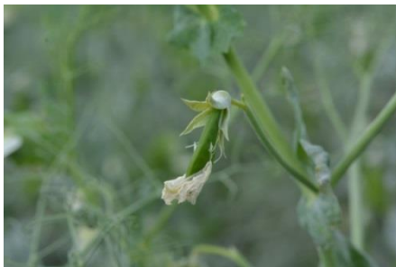
L. JUNG - CETIOM

Le stade JG2CM correspond à l'apparition des premières gousses. Elles mesurent 2 cm de long. Ce stade marque le début de la sensibilité du pois à la bruche du pois et à la tordeuse, et de la féverole à la bruche de la fève.