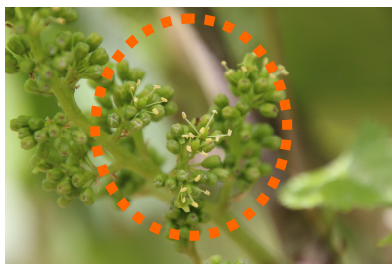
MLA – 25/05/15 Chardonnay H 19 «Toutes 1ères fleurs»