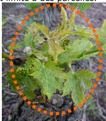
MB - 25/05/15 Eutypiose sur Sauvignon

Des symptômes d'Eutypiose dans certaines parcelles notamment de Sauvignon sont bien visibles actuellement mais cela reste cependant limité à des parcelles.