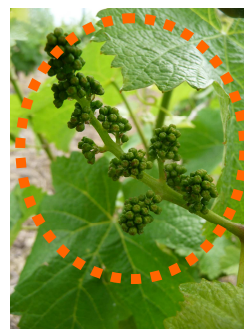
MB – 25/05/2015 Gamay H 17 « BF séparés »