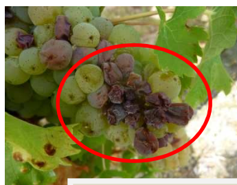
MB - 06/09/18 Grillure de raisin sur Sauvignon

Bulletin rédigé par Michel BADIÉ - CDA 41 en collaboration avec le comité de rédaction.