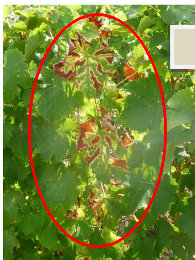
MB - 06/09/18 Forme « lente » d'ESCA

Sur les parcelles atteintes, il y a souvent les 2 formes présentes d'expression (lente et apoplexie) et lorsque l'on cumule sur une même parcelle les formes, environ 36 % des parcelles ont plus de 8% de souches présentant des symptômes.