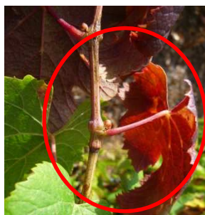
Partie du rameau décoloré

Il est très fréquent de voir actuellement au vignoble sur des parties hautes de rameaux, des décolorations de feuilles en rouge (cépage rouge). Lorsque l'on observe la zone de changement de couleur, on voit un étranglement ou une incision annulaire