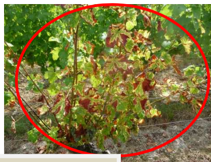
MB - 06/09/18 Forme apoplexie d'ESCA