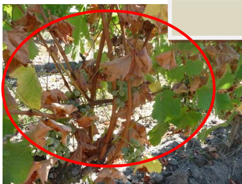
MB - 06/09/18 Stress hydrique sur Sauvignon

Août : Quelques différences selon les sites mais globalement très faibles: de 14 à 27 mm