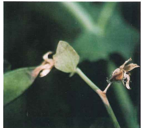
Dégâts sur jeune gousse et destruction de fleur