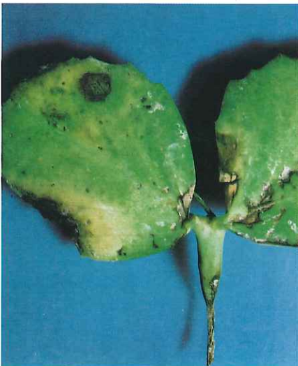
Infection primaire d'une plantule à partir du sol