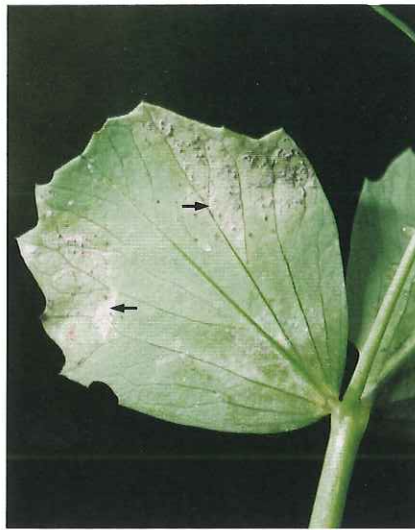
Début de fructification sur la face inférieure