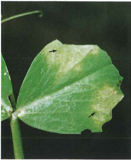
Face supérieure d'une foliole : symptôme en «tache d'huile»