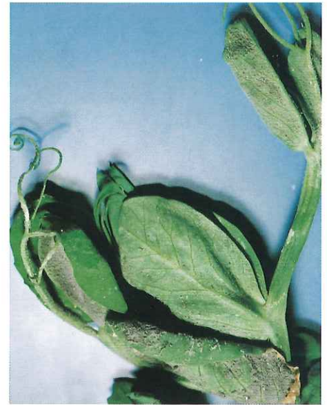
Fructification sur feuilles âgées et pousse