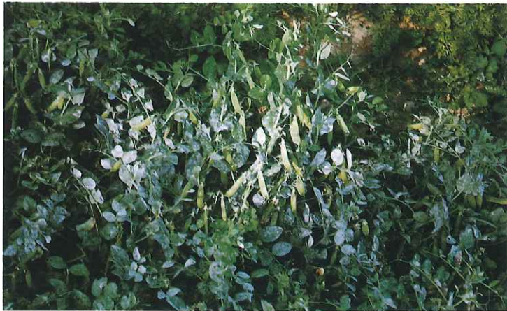
Attaque généralisée en phase de grossissement des gousses