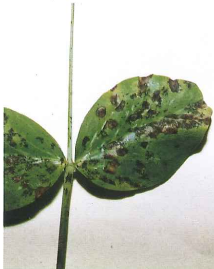
Attaque sur feuille et pétiole