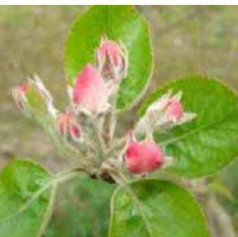
Stade E2 « Avant fleur »