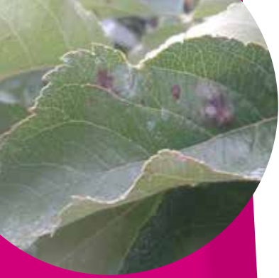
Tavelure sur feuille