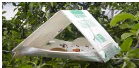
Piège à carpocapse - ©Coveta