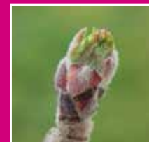
Pommier : Stade C «Eclatement des bourgeons»