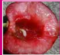
Asticot de Rhagoletis cerasi dans fruit

En général, un asticot par cerise bien visible.