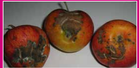
Tavelure sur pommes

Sur mes pommiers et mes poiriers, les feuilles et les fruits sont d'abord tachés, puis des croûtes liégeuses apparaissent sur les fruits qui finissent par se craqueler.