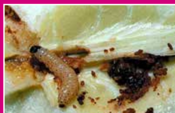
Chenille de carpocapse

Les dégâts sont causés par la chenille d'un papillon, le carpocapse des pommes et des poires (Cydia = Laspeyresia pomonella) qui peut également être présent sur noyers, cognassier, pruniers et abricotiers.