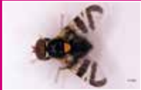
Adulte de Rhagoletis cerasi