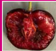
Dégât sur fruit D Susukii

Plusieurs asticots difficiles à voir à l'œil nu. Le fruit ramollit très vite. D'autres fruits rouges comme les fraises, framboises, et mûres peuvent être touchés.