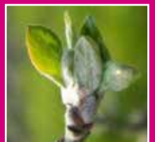
Pommier : Stade C3 «Oreille de souris»