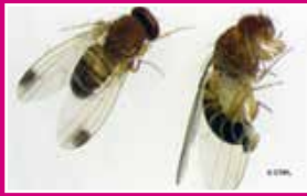
Adultes de Drosophila suzukii

Rhagoletis cerasi : Confirmer le diagnostic à l'aide de pièges de couleur jaune à installer mi- mai côté midi. Cette technique de piégeage peut permettre de limiter les populations de mouches à condition de multiplier les pièges dans l'arbre (3 à 5 pièges au minimum). Mais lorsque la pression du ravageur est trop forte, le piégeage peut s'avérer insuffisant.