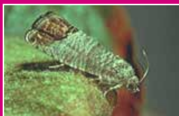
Papillon de carpocapse

Les dégâts sont causés par la chenille d'un papillon, le carpocapse des pommes et des poires (Cydia = Laspeyresia pomonella) qui peut également être présent sur noyers, cognassier, pruniers et abricotiers.