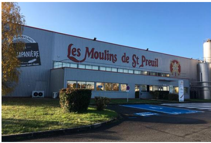
A proximité de leur usine de ST PREUIL (16)