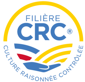
Blé CRC VRM

Exploitation Niveau 2 de la certification environnementale