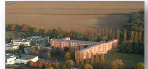
Lycée agricole de Tours Fondettes Agrocampus