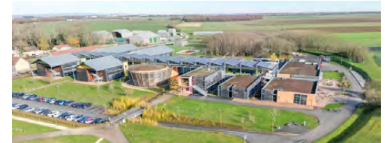
Campus Natur'Alim de Chartres-La Saussaye