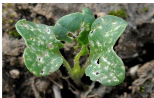
Plus de 25 % de la surface touchée