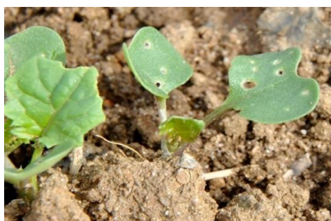
Moins de 25 % de la surface touchée

→ 8 pieds sur 10 portants des morsures. Il ne faut pas dépasser plus ¼ de la surface végétative détruite. Au-delà du nombre de plantes avec dégâts, il est important de déterminer la surface végétative endommagée. En cas de levée tardive (après le 1 er octobre), la vitesse de développement des colzas est ralentie et le seuil peut être abaissé à 3 plantes avec morsures sur 10.