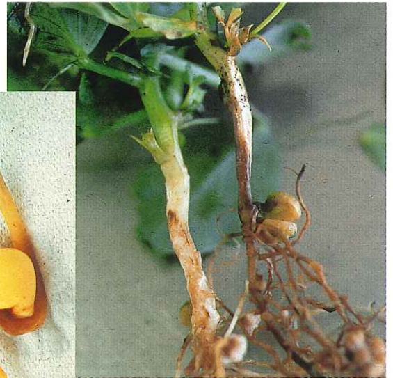
Aphanomyces euteiches sur pois sur stade avancé.