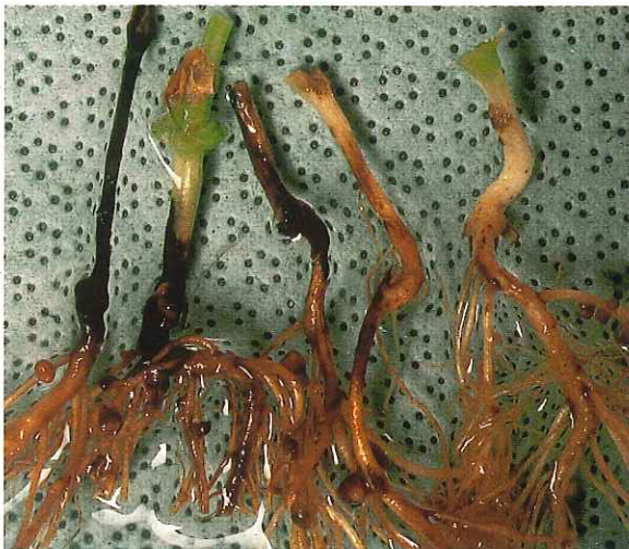
Complexe parasitaire à Fusarium solani et Phoma medicaginis var. pinodella sur pois.