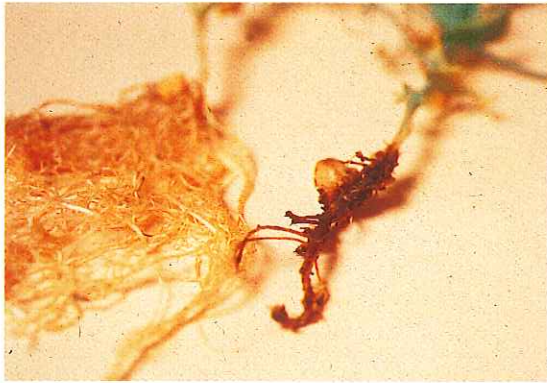
Pythium irregulare sur racicelles de pois.

MINISTÈRE DE L'AGRICULTURE SERVICES DE LA PROTECTION DES VÉGÉTAUX