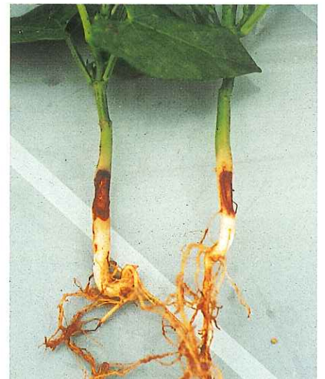
Rhizoctonia solani sur haricot.