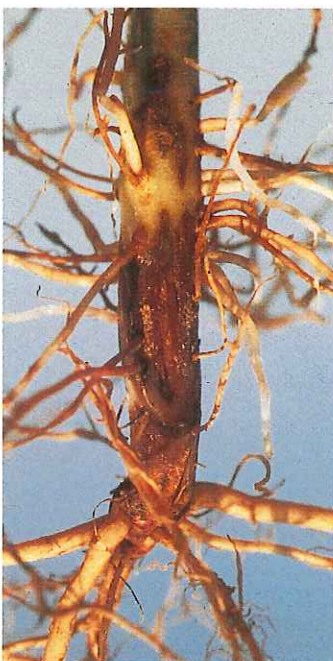
Complexe parasitaire à dominante de T. basicola sur haricot.