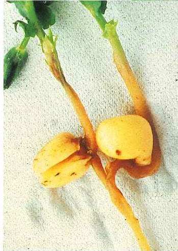
Sur stade jeune. S.R.P.V. Centre - D. DIDELOT.