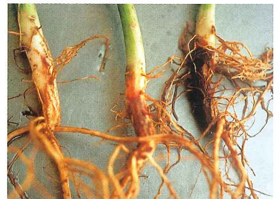
Complexe parasitaire à Fusarium solani et Thielaviopsis basicola sur haricot (dominante F. solani ). S.R.P.V. Centre - D. DIDELOT.