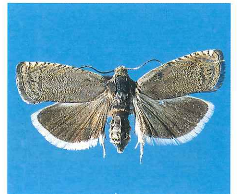
Papillon mâle (envergure 15 mm)