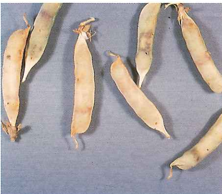
Dégâts sur gousses : perforation de la paroi