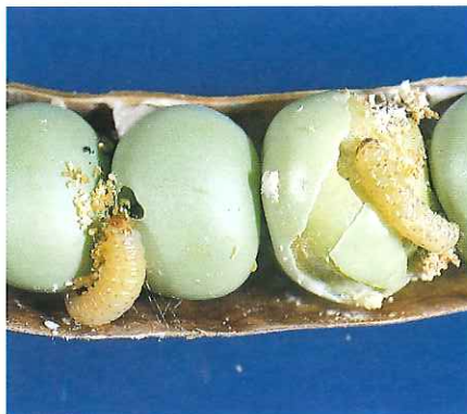
Chenilles (2 à 5 mm). Dégâts sur grains