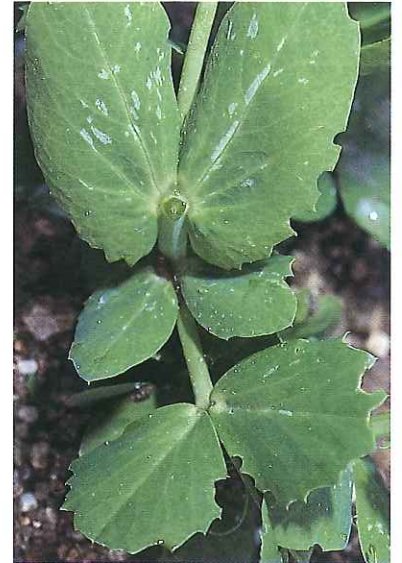
Morsures caractéristiques d'adultes en bordure de folioles