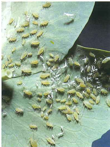
Pullulation de pucerons verts sur feuille