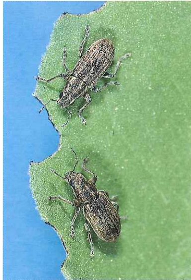
Adultes sur feuilles (4 à 5 mm)