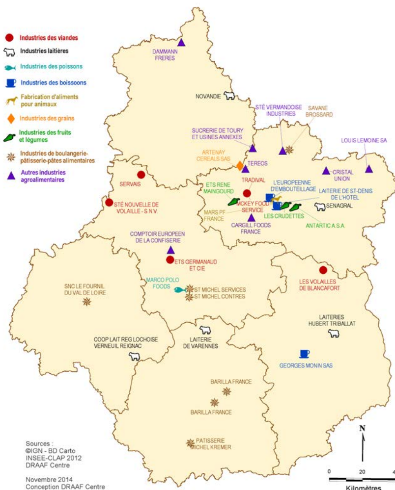
Etablissements agroalimentaires de 100 salariés et plus dans le Centre en 2012

près de 20 % des établissements et 40 % des emplois. Loin derrière, le Loir-et-Cher se positionne en deuxième place en terme d'emplois (16 %) suivi par l'Indre et le Cher. C'est l'Indre-et-Loire qui ferme le classement avec un nombre relativement faible d'emplois (moins de 1 000), mais un tissu relativement important d'entreprises, essentiellement de petite taille. Les principales régions d'implantation des IAA en France sont toujours la Bretagne, les Pays de la Loire et Rhône-Alpes, qui concentrent à elles trois 36 % des effectifs salariés.